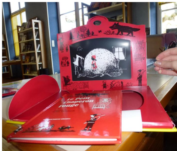
Aperçu du théâtre d'ombres :